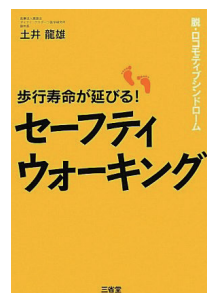
土井氏ご著書 (三省堂)

1952年生まれ。 大阪教育大学保健体育学科卒。 医療法人貴島会ダイナミックスポーツ医学研究所顧問。 神戸製鋼ラグビー部や競馬の武豊騎手、ゴルフの江連忠プロ、 フェンシングの太田雄貴選手などのスポーツ選手から、104 歳の高齢者まで約1万人のリハビリやトレーニング指導を担当。 事業所や自治体での、腰痛や生活習慣病、介護予防などの対策 プロジェクトに数多く参画してきた。 主な著書に『歩行寿命が延びる！セーフティウォーキング(三省堂)』、 共著に『歩く人。長生きするには理由がある(創英社/三省堂書店)』がある。