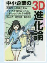
弊社代表共著 (ライティング)